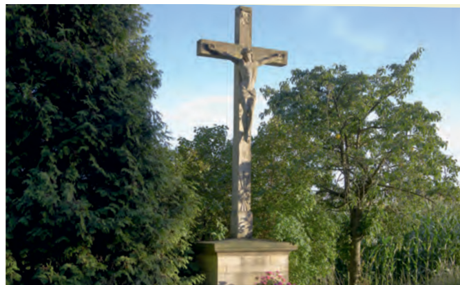
links: das Steinkreuz in der Gesamtansicht rechts: die Marterwerkzeuge