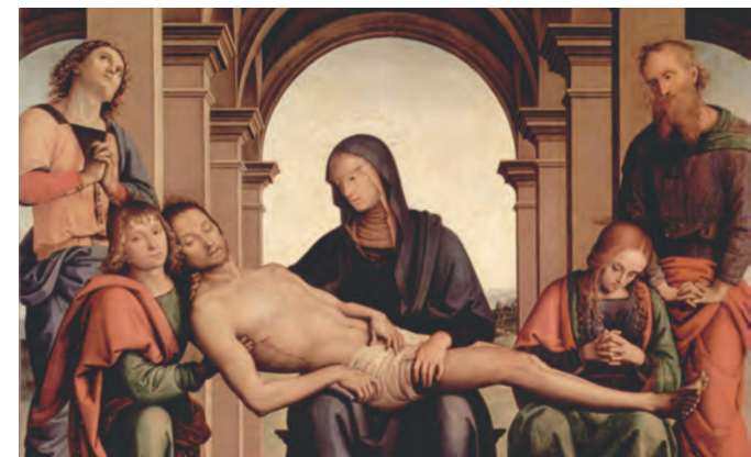
links: Der italienische Künstler Perugino schuf im 15. Jahrhundert diese Darstellung Marias mit dem vom Kreuz abgenommenen Jesus.

Die Pietà (it. für „Frömmigkeit, Mitleid“), auch Vesperbild genannt, ist in der bildenden Kunst die Darstellung Marias als Mater Dolorosa (Schmerzensmutter) mit dem Leichnam des vom Kreuz abgenommenen Jesus Christus. Im Gegensatz zur Beweinung Christi liegt der Leichnam Jesu immer in Marias Schoß. Das Motiv ist in der Bildhauerkunst seit dem frühen 14. Jahrhundert gebräuchlich und wird von der älteren Forschung in Verbindung mit der Entstehung des Andachtsbildes gebracht. Der Frömmigkeitsgeschichtliche Ursprung ist in der verstärkten Hinwendung zum Leiden Christi am Kreuz und des Mitleidens seiner Mutter mit ihrem Sohn zu sehen.